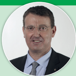
Burgherr Thomas (SVP)