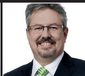
Flach Beat (GLP)