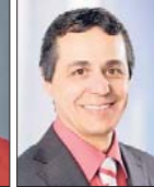
Ignazio Cassis, PLR, Montagnola TI