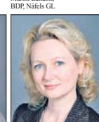
Isabelle Moret, PLR, Lausanne VD