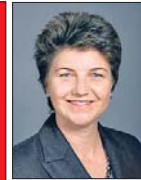
Viola Amherd, CVP, Brig-Glis VS