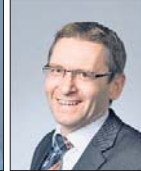
Pirmin Bischof, CVP, Solothurn SO