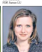
Christa Markwalder, FDP, Burgdorf BE