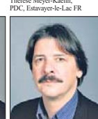
Paul Rechsteiner, SP, St. Gallen SG